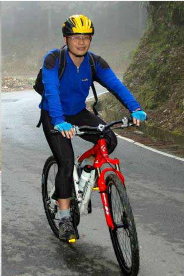
▲忠厚老實的學弟，連安全帽都一樣啊!