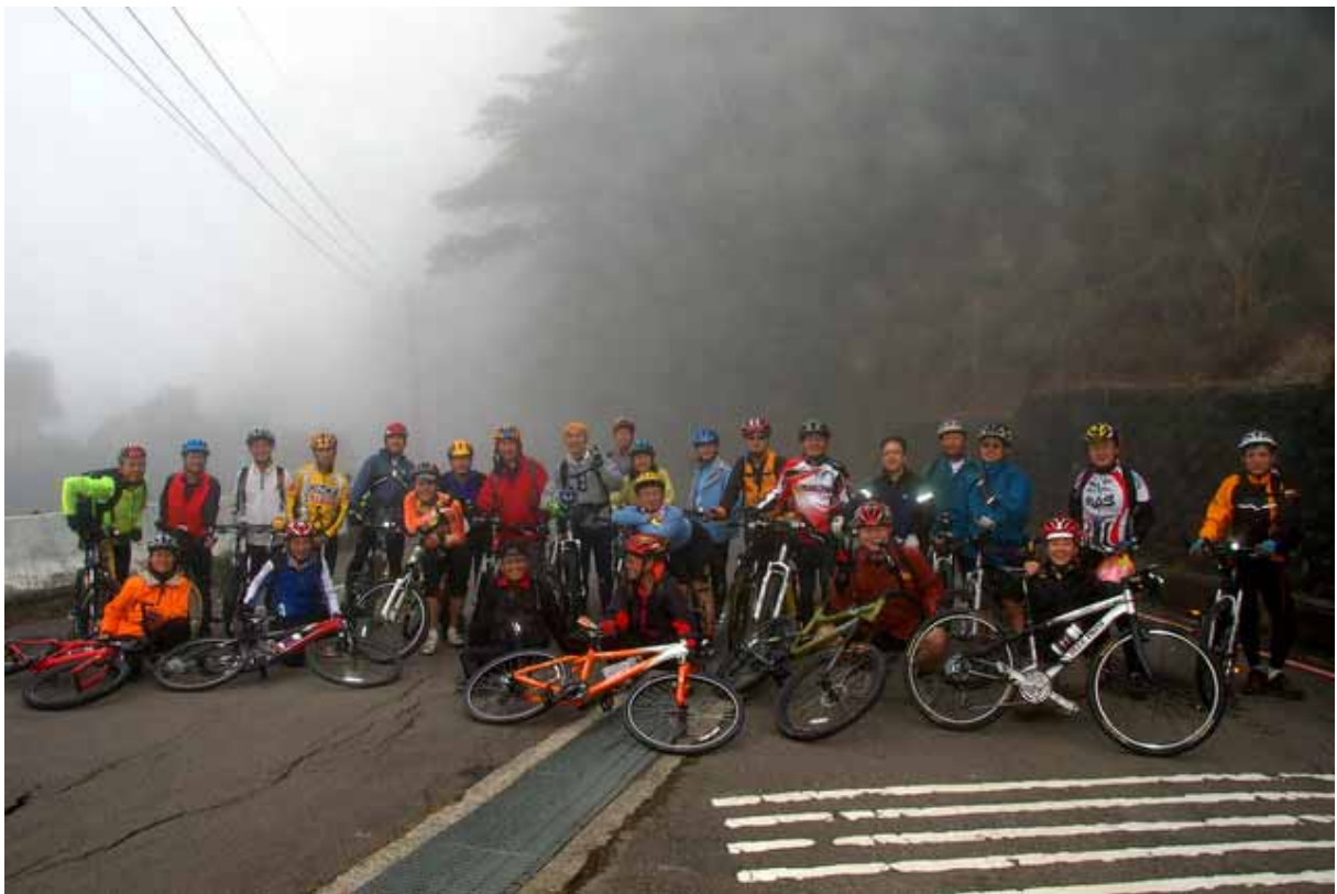
▲ 國家公園觀霧管理站 合照