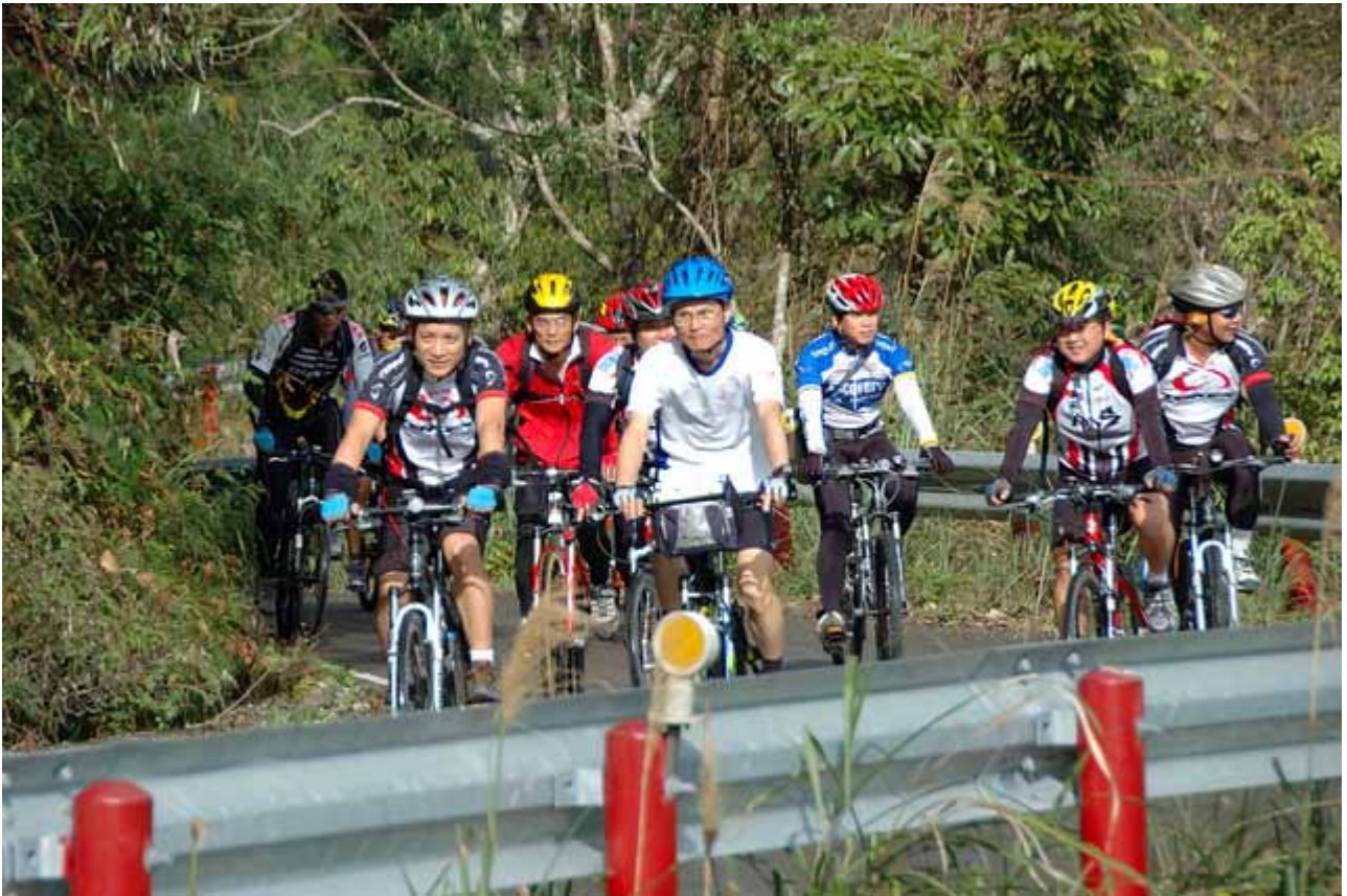
▲占據林道與共享大鹿的一切美景

又是一趟穿梭林道的輕鬆愉快與舒暢之旅，這是 中華民國駱駝登山會 的年度活動之一，總計 52 位熱情騎士報名，最後有 49 位朋友赴會同樂。我們占據了幽靜的林道，一同享受大鹿林道的一切美景。從清泉溫泉到 國家公園觀霧管理站 的神木，來回悠遊騎乘了 57 公里，爬升 1600 米，絲毫沒有倦容，只有讚嘆眼前美景與嘆息一天的時光匆匆，我們一定會再來的，美麗的 觀霧 。下回單車之旅再見囉！下回的林道之旅暫定 羅山林道 囉！