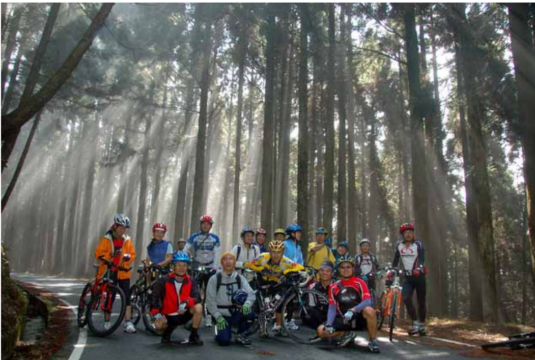
▲陶醉於冬陽乍現的濃霧柳杉林之中

若來觀霧旅遊，這一片的杉木林區絕對不容錯過，這是大自然賜予的珍貴美景，一定要駐足且深深的呼吸，並讓肌膚接觸與吸收這濃濃的芬多精(Pythoncidere)，將使我們覺得自己更加的清新而且充滿著能量，精神隨之振奮、心情也隨之愉悅，這種大自然的饗宴是最健康與最經濟的。朋友們，台灣的山林真的蘊藏了許多無限珍貴的寶藏，我們共同的珍惜與享受。