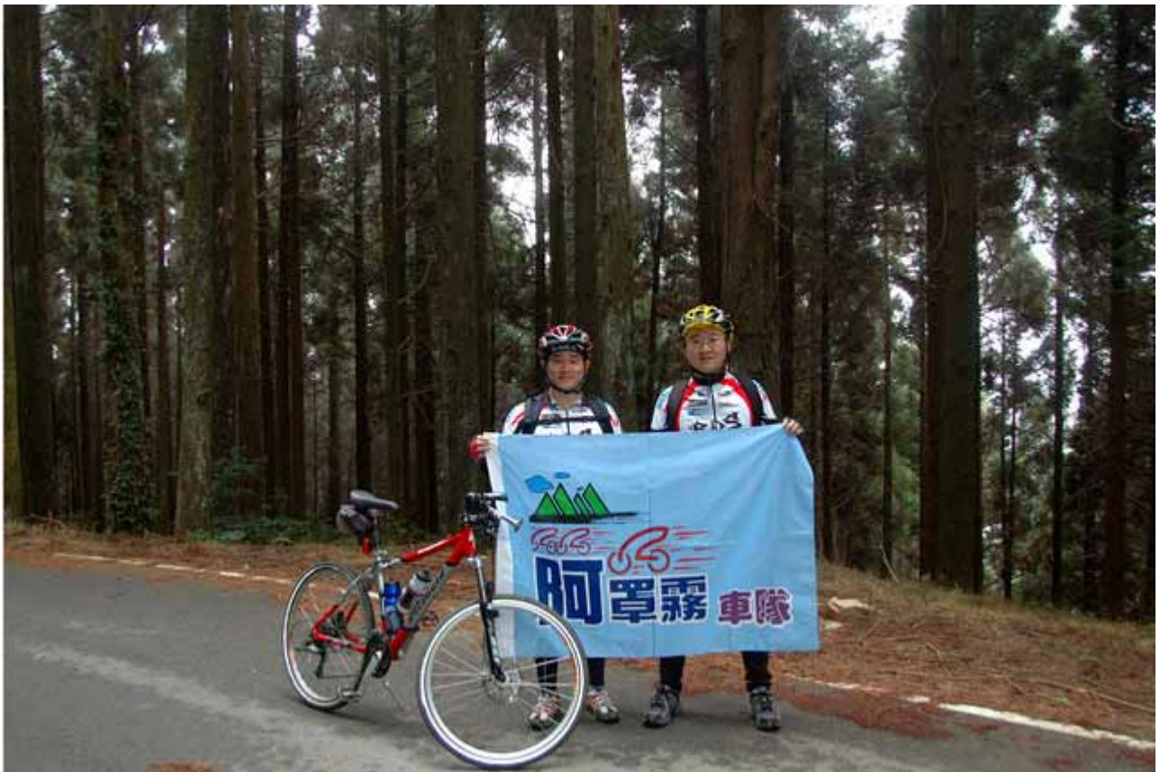
▲ 阿罩霧車隊 來訪，難怪濃霧籠罩啊!呵呵!