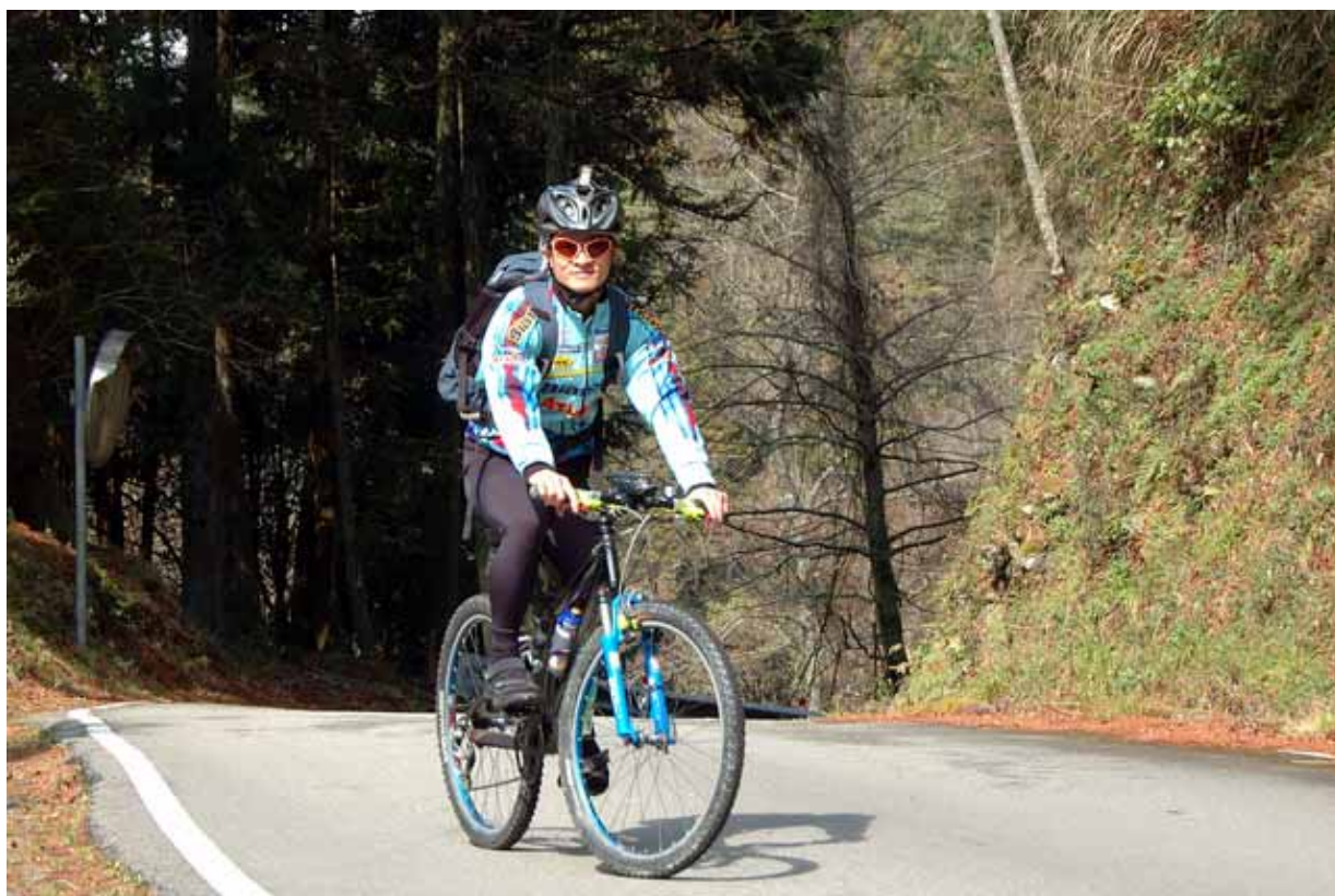
▲ 魔王 再現山林