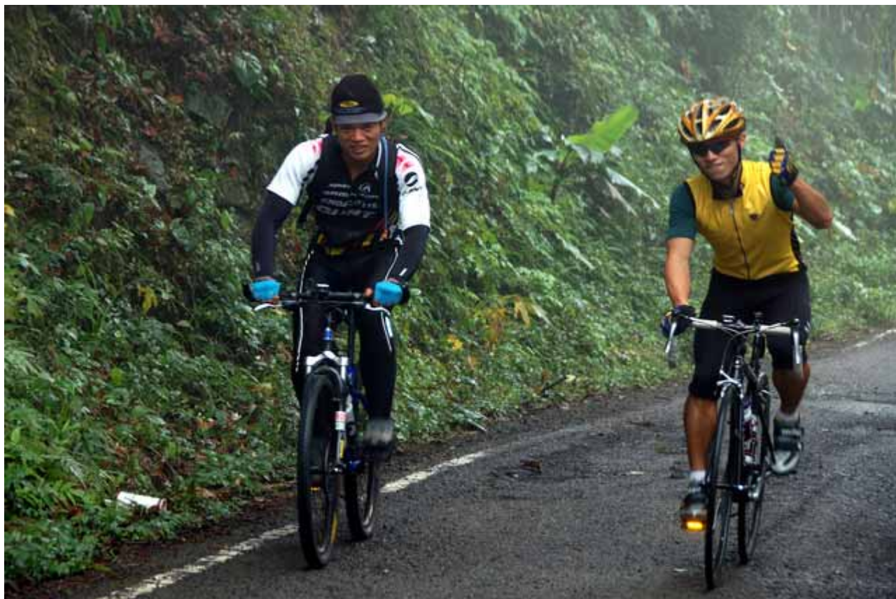
▲單車高手，右邊勇腳還騎公路車上山呢!第一次看到吧!