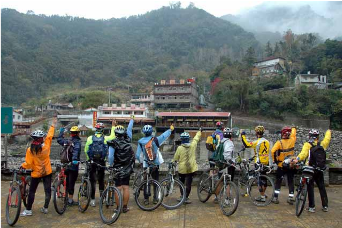
▲再見觀霧，我們將再來!

騎乘玩樂了一天，大家趕到亞外農場盡情吃喝， 五菜一湯 又加大碗炒麵與無限供應的白飯，經過一片安靜中的肆虐後，可謂「肴核已盡，杯盤狼藉。」真的已滿足飢餓的肚子了。親切的老闆娘還說：「還有一道高麗菜喔!」我們急忙說：「喔!不用了，年後的 白蘭賞櫻之旅 再來吃啦!謝謝!」