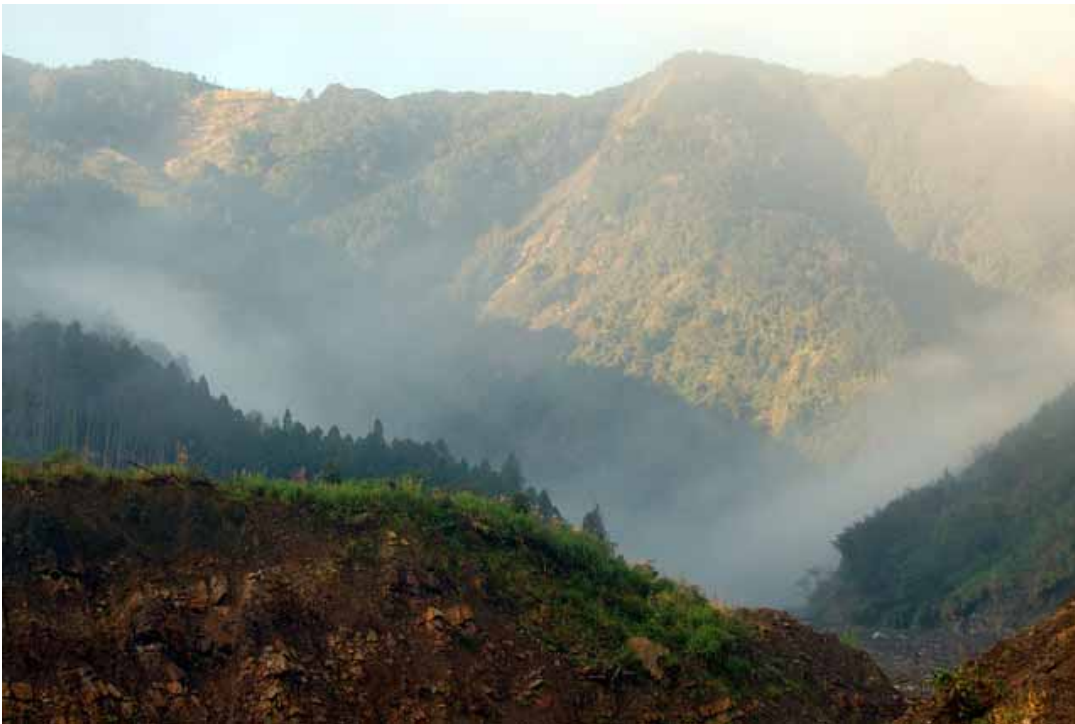
▲ 土場 的 旭陽 與 晨霧

大夥尚未熱身之際，就面臨從 上坪溪底 的 清泉溫泉 沿路攀升到 土場 之路段，雖然一大群騎士霸占 122 線道的最後 2 公里路程，有些過癮與爽快，但實際上是有些氣喘啊！不過在寬闊的 土場 土石流區休息與觀景後，很快的又恢復騎乘鬥志了。2004 年及 2005 年八月的 艾利 與 馬莎 颱風重創大鹿林道， 土場 檢查哨與鐵橋被山崩與土石流完全的掩埋與摧毀，我們對堅守崗位而犧牲的警察先生致敬。