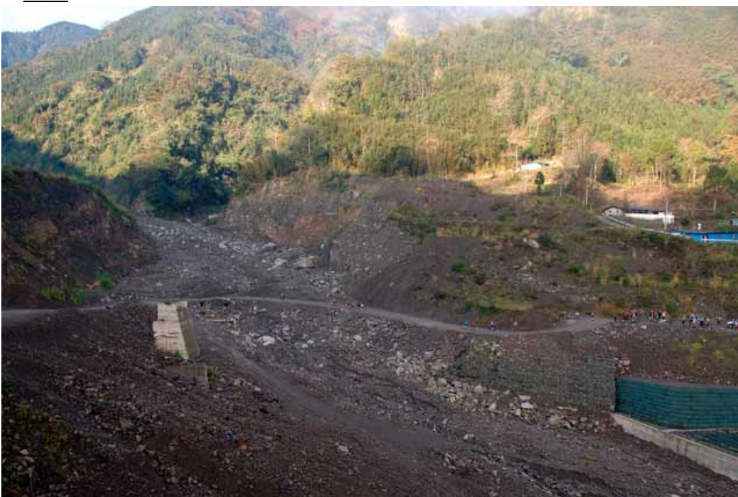
▲昔日的 土場 檢查哨 與 鐵橋 所在地