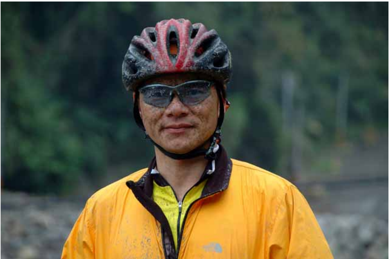
▲SSWu與紅鵲再次謝謝大家，我們下回林道單車之旅再見囉!