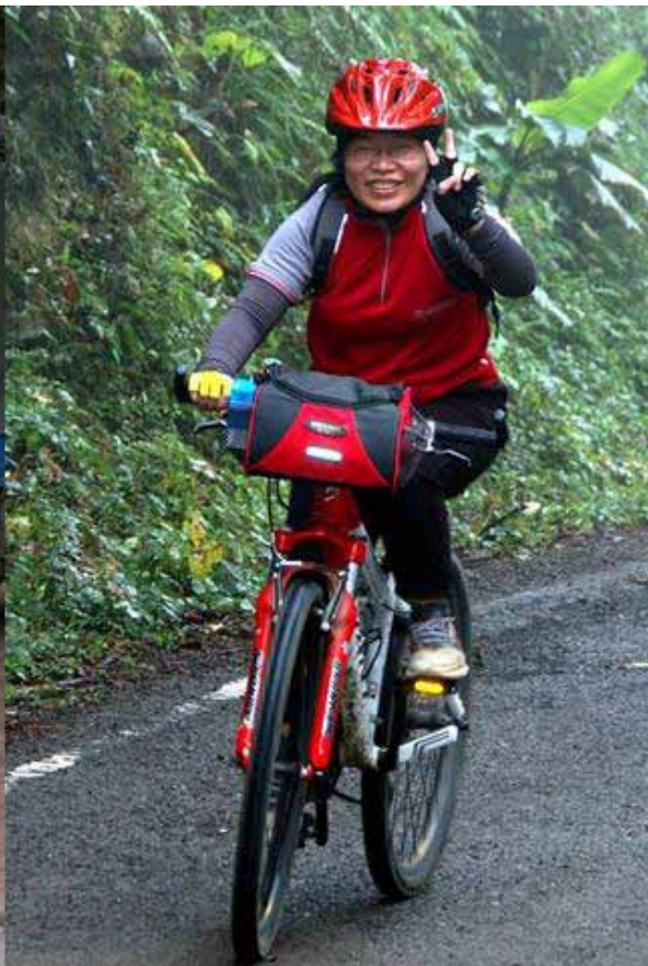
▲駱駝姐妹淘與仔仔