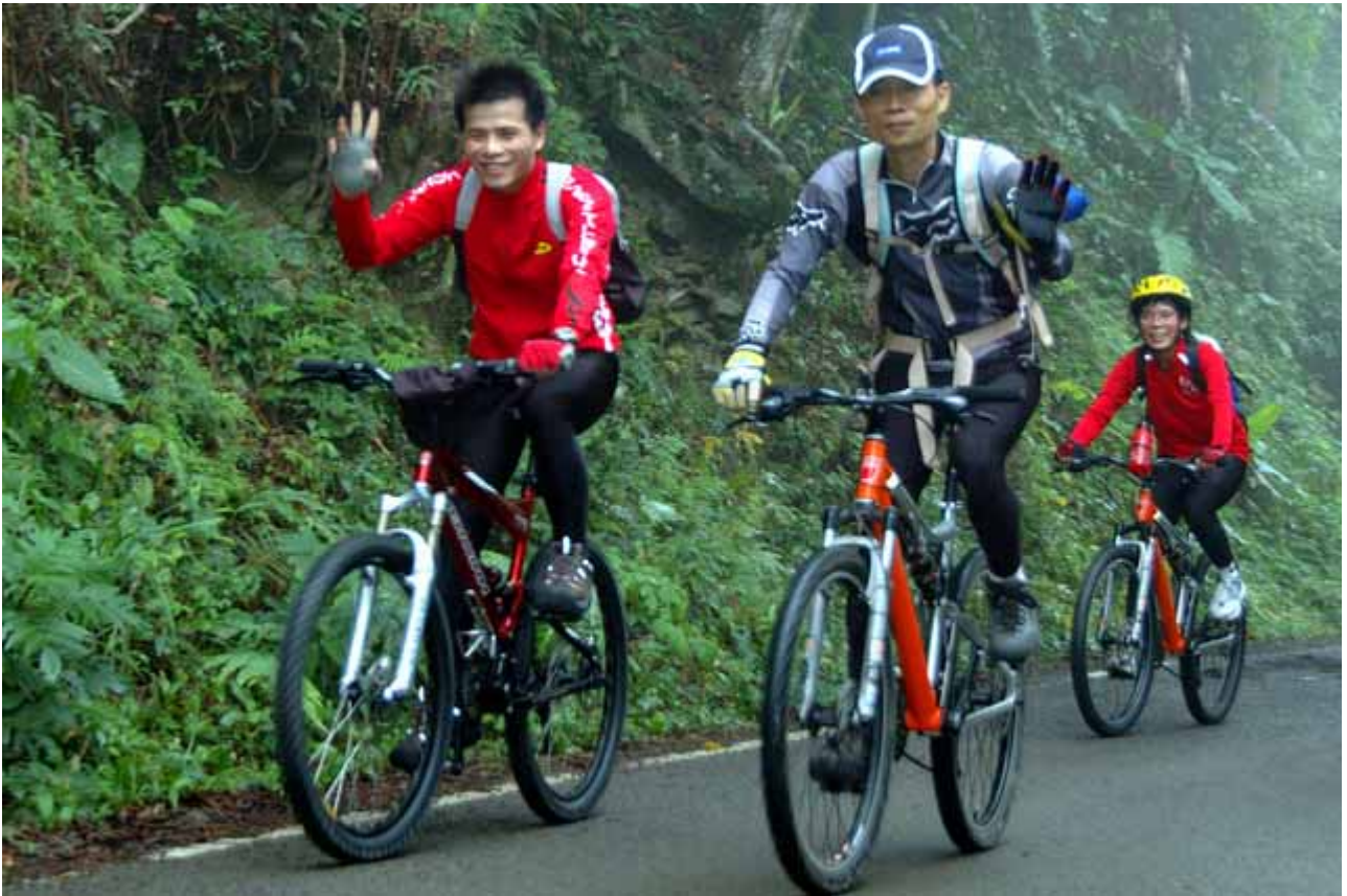
▲小龍家族，建議您戴安全帽喔!