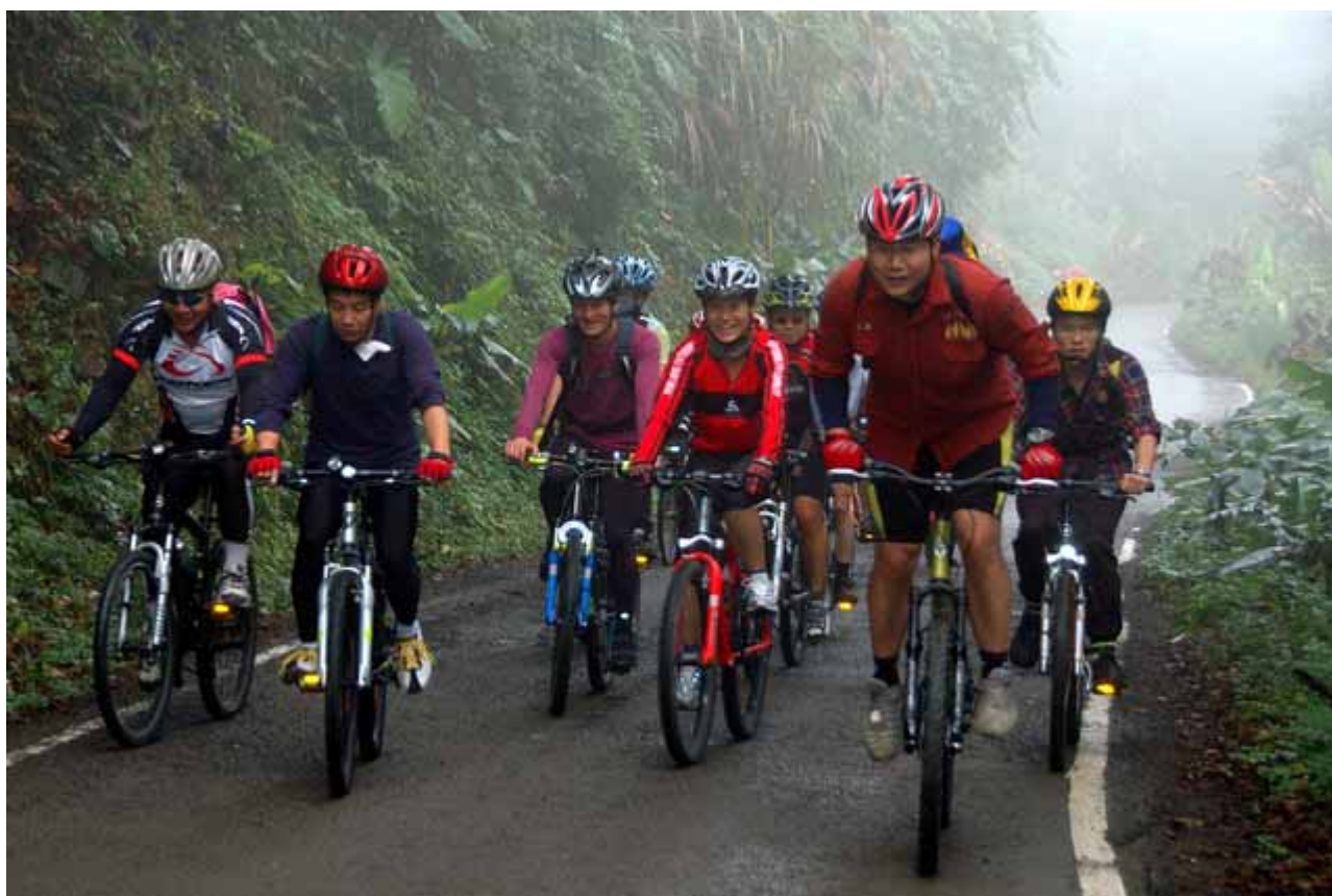
▲占據林道與共享 太鹿 的一切美景